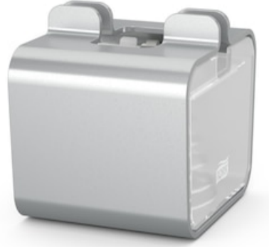
Tork Xpressnap Image Snack Dispensador S 274003