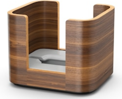
Tork Xpressnap Image Snack Dispensador S 273003