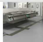
Suelos industria alimentaria