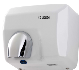
REF: CS-500-X Acabado METAL LACADO BLANCO