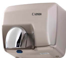
REF: CS-500-S/X Acabado ACERO SATINADO