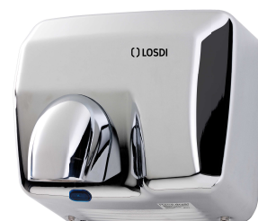
REF: CS-500-I/X Acabado ACERO BRILLO