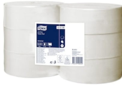
Tork Papel higiénico Jumbo 120160