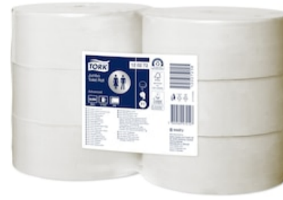
Tork Papel higiénico Jumbo 120272