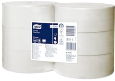
Tork Papel higiénico Jumbo 110162