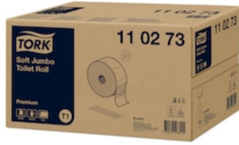
Tork Papel higiénico Jumbo Suave 110273